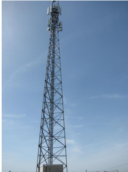
Zaf. nr 1: Widok ogólny instalacji radiokomunikacyjnej.