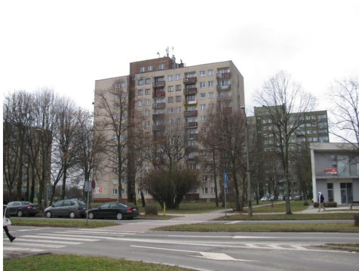
Zał. nr 1: Widok ogólny instalacji radiokomunikacyjnej.