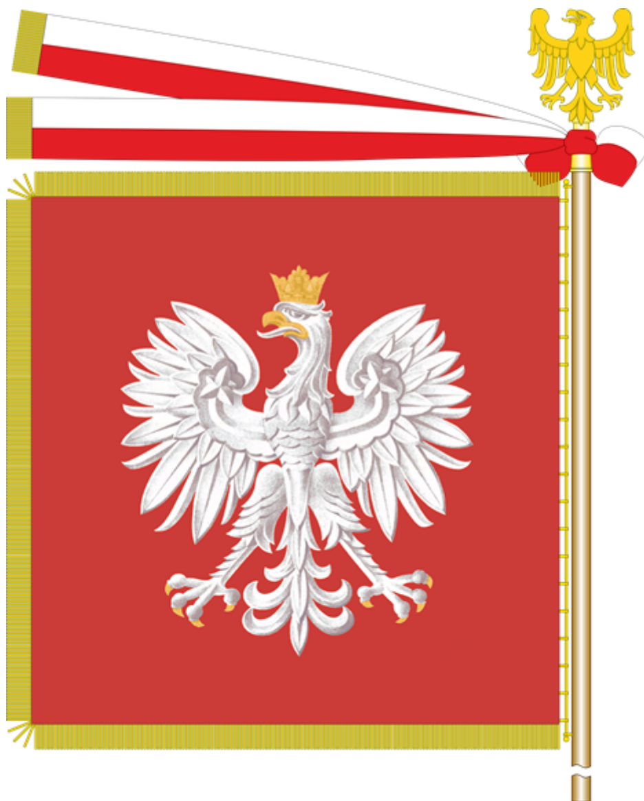
Sztandar Powiatu Zawierciańskiego – strona prawa