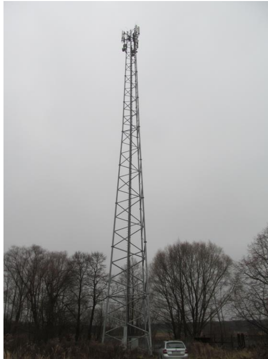
Zaf. nr 1: Widok ogólny instalacji radiokomunikacyjnej.