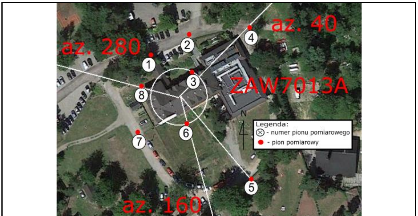
Zdjęcie satelitarne: Image © 2022 Google

Załącznik nr 2 – Rysunek poglądowy terenu, rozmieszczenie pionów pomiarowych na terenie wokół stacji, powiększenie