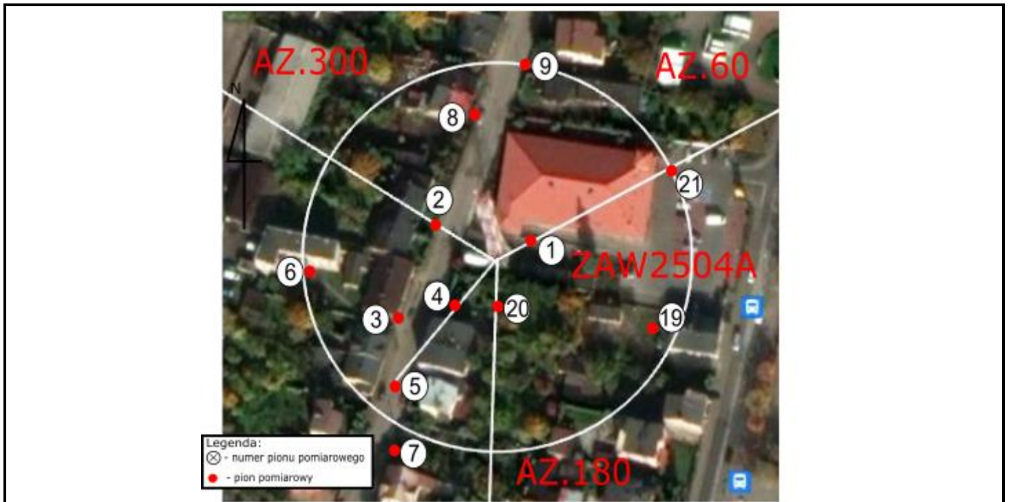
Zdjęcie satelitarne: Image © 2021 Google