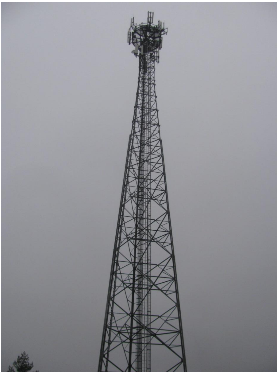
Zof. nr 1: Widok ogólny instalacji radiokomunikacyjnej.